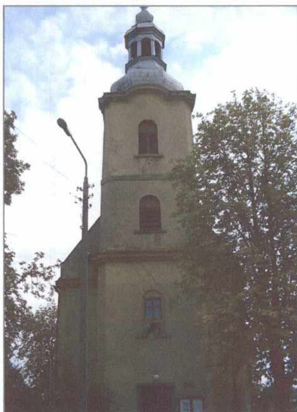
kościół p.w. Narodzenia NMP

Od czasów średniowiecza, mimo kolonizacji niemieckiej przeważała tu ludność polska.