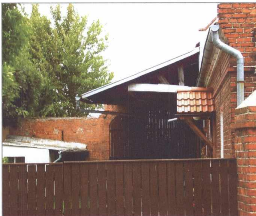
Podwórko Pawlaków i Kargulów