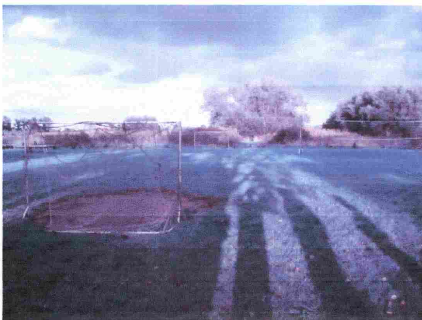
Boisko przy placu zabaw