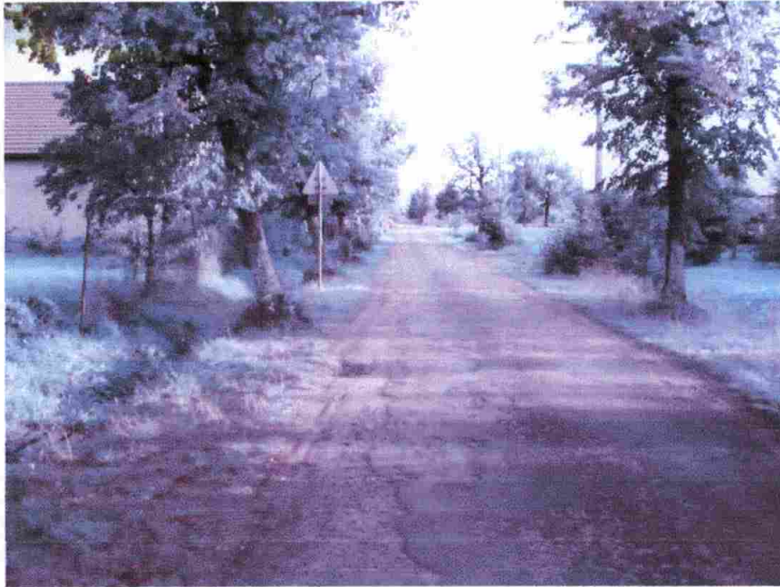
Pas zieleni przy głównej ulicy