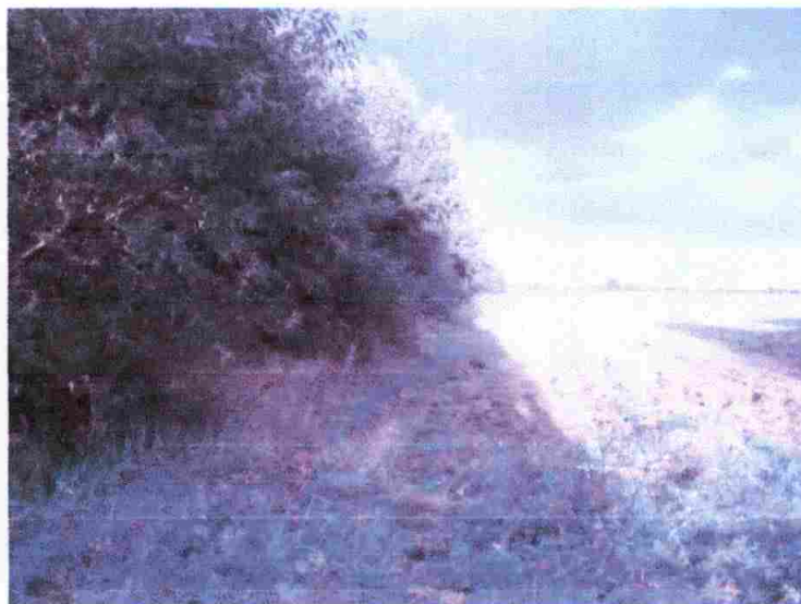
Miejsce pod budowę świetlicy