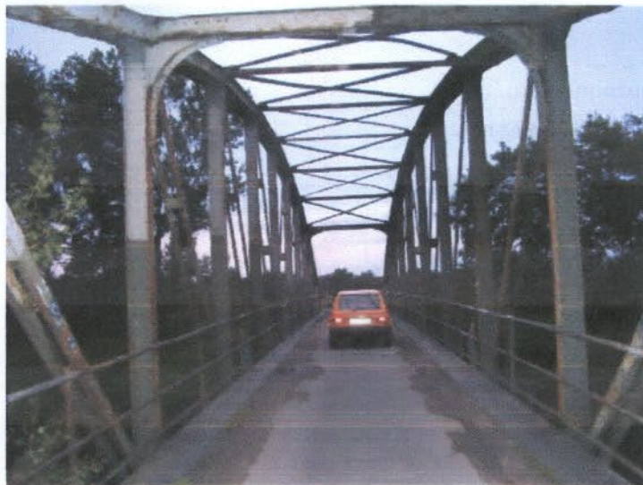
Zabytkowy most drogowy na Kanale Janowickim