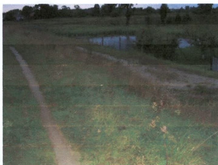
Planowane ścieżki rowerowe