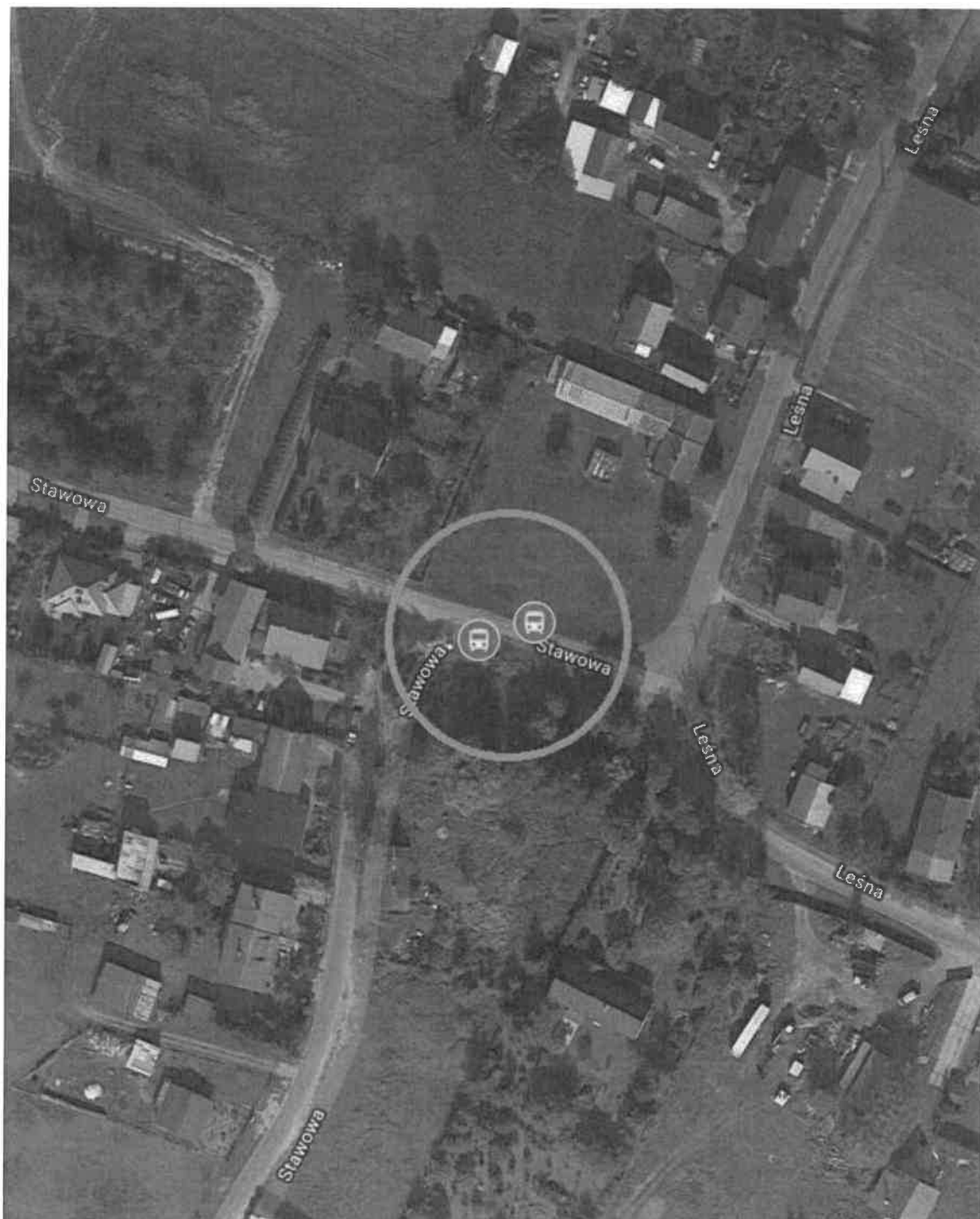
Nr przystanku: 22, 23