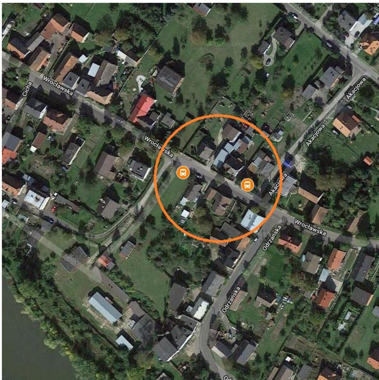
Nr przystanku: 25, 26