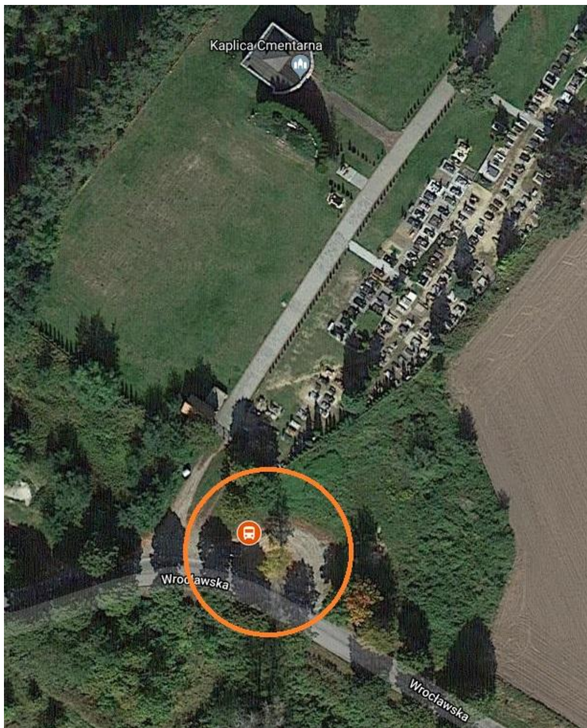
Nr przystanku: 24