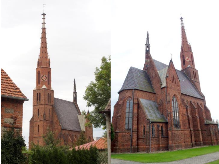
Zdjęcia nr 4, 5. Kościół pw. Niepokalanego Poczęcia NMP w Chrzastawie Wielkiej

Kościół halowy, trójnawowy, orientowany, na rzucie krzyża łacińskiego, z węższym i niższym prezbiterium zamkniętym ćwierćkoliście i z wieżą na osi elewacji zach., z wąską wieżyczką klatki schodowej od półn. Budynek oszkarpowany. Dachy dwuspadowe, kryte płytkami cementowymi, uzupełnione blachą, na wsch. krańcu dachu korpusu – smukła sygnaturka. Wieża w przyziemiu czworoboczna, w górnej kondygnacji ośmioboczna, zwieńczona smukłym murowanym z cegły stożkiem, zdobionym sterczynami z piaskowca, z pinaklem w zwieńczeniu. Detal architektoniczny ceglany: gzymsy, węgary i laskowania okien oraz z piaskowca: portale, sterczyny, żabki. Otwory okienne zamknięte ostrołucznie, w prezbiterium – witraże o tematyce roślinnej. Otwory wejściowe zamknięte łukiem dwuramiennym, w portalach z piaskowca. W tympanonie portalu zach. – inicjał „AL.” w tarczy herbowej i data „1860”; w zwieńczeniu – krzyże. Wewnątrz sklepienie krzyżowe.