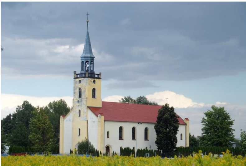
Zdjęcia nr 12. Kościół pw. MB Różańcowej w Nadolicach Wielkich

Kościół pw. MB Różańcowej w Nadolicach Wielkich , wcześniej ewangelicki, wzniesiony w latach 1847-1849, wg projektu inspektora budowlanego Zahna, neoromański. W 1862 r. zakończono przebudowę kościoła, w czasie której dostawiono do niego wieżę.