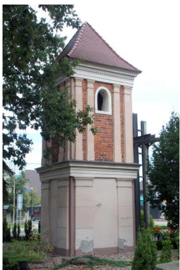
Zdjęcie nr 26. Dzwonnica pożarowa w Czernicy, ul. Wrocławska/Jana Pawła II

– Dzwonnica pożarowa w Czernicy, ul. Wrocławska/Jana Pawła II.