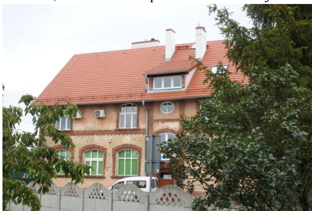
Zdjęcie nr 35. Szkoła, ob. Zakład Gospodarki Komunalnej w Ratowicach, ul. Wrocławska 111

– Szkoła, ob. Zakład Gospodarki Komunalnej w Ratowicach, ul. Wrocławska 111;