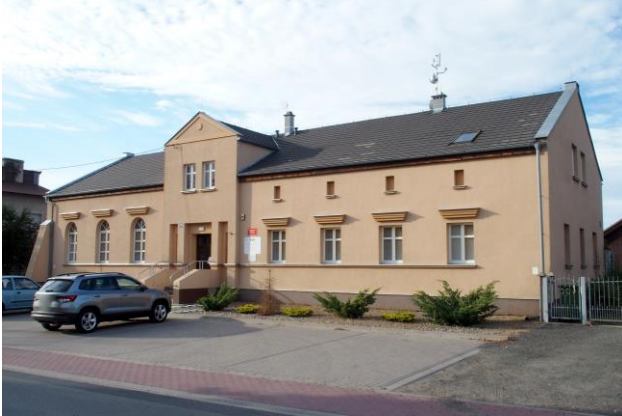
Zdjęcie nr 36. Gospoda, ob. świetlica wiejska w Wojnowicach, ul. Główna 41

– Gospoda, ob. świetlica wiejska w Wojnowicach, ul. Główna 41.