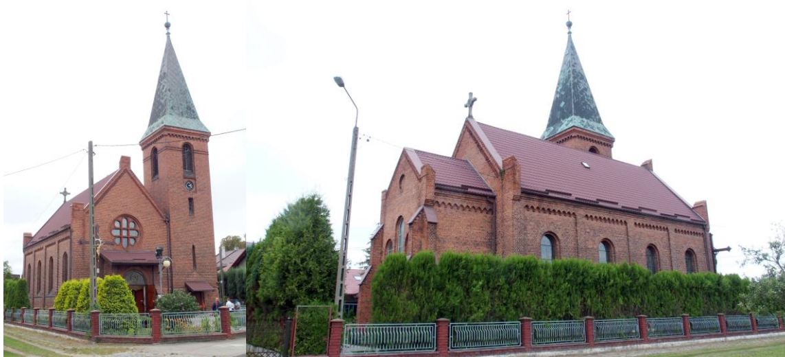
Zdjęcia nr 13, 14. Kościół pw. św. Antoniego w Ratowicach

Kościół murowany z cegły, na rzucie prostokąta, z prostokątnym, oszkarpowanym narożnie prezbiterium z towarzyszącą mu prostokątną zakrystią i z czworoboczną wieżą w narożniku fasady korpusu. Ściany murowane z cegły z ceglany detal: rozczłonkowane lizenami spiętymi w zwieńczeniu nadwieszonym fryzem arkadkowym. Podobny fryz w zwieńczeniu ścian prezbiterium. W dolnej kondygnacji okna koliste, w górnej – zamknięte łukiem okrągłym. W fasadzie płytka kruchta pod dachem pulpitu i wielkie przeszklone tondo z ceglany laskowaniem w formie stylizowanej rozety.