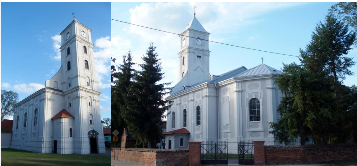
Zdjęcia nr 10, 11. Kościół pw. św. Małgorzaty w Gajkowie