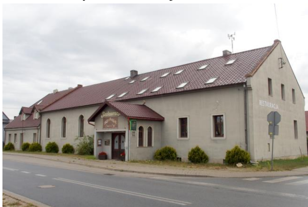
Zdjęcie nr 32. Dom ludowy, ob. restauracja w Nadolicach Wielkich, ul. Wrocławska 64

– Dom ludowy, ob. restauracja w Nadolicach Wielkich, ul. Wrocławska 64;