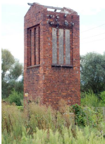
Zdjęcie nr 25. Transformator w Czernicy, ul. Kochanowskiego

– Transformator w Czernicy, ul. Kochanowskiego;