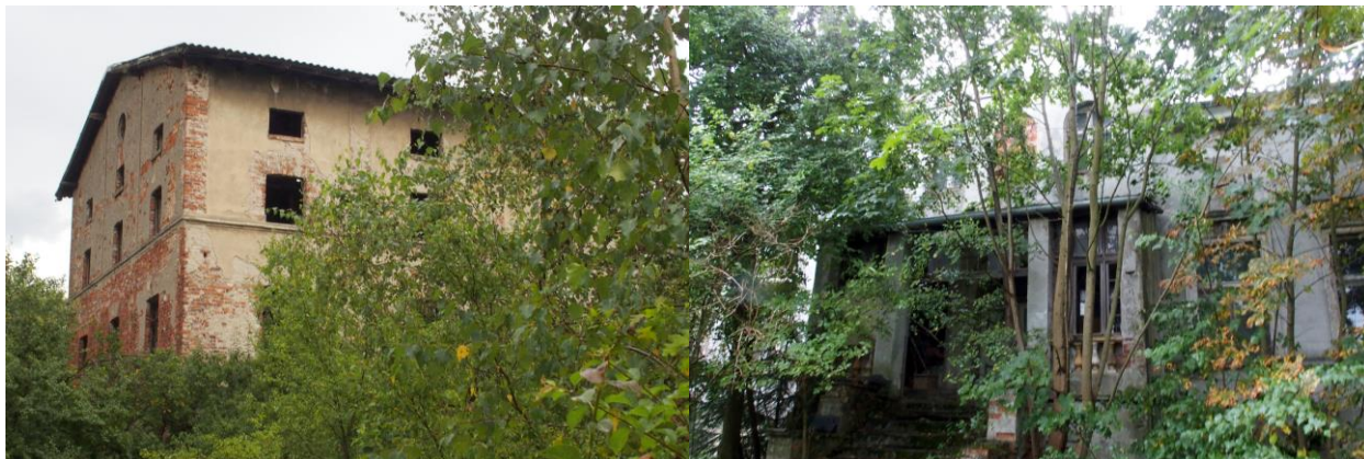
Zdjęcia nr 19, 20. Dawny budynek młyna i dawny dom młynarza w zespole młyna w Nadolicach Wielkich przy ul. Rzecznej 53

Kolejnym elementem technicznego dziedzictwa kulturowego są młyny, nawet całe zespoły młyńskie, jak zespół młyna w Nadolicach Wielkich przy ul. Rzecznej 53 (rejestr zabytków), obejmujący zbożowy młyn wodny, dom młynarza, ob. budynek mieszkalny i chlewnię z gołębnikiem, datowane na 2 poł. XIX w. i pocz. XX w. Obiekty zespołu młyna są w bardzo złym stanie, popadają w ruinę.