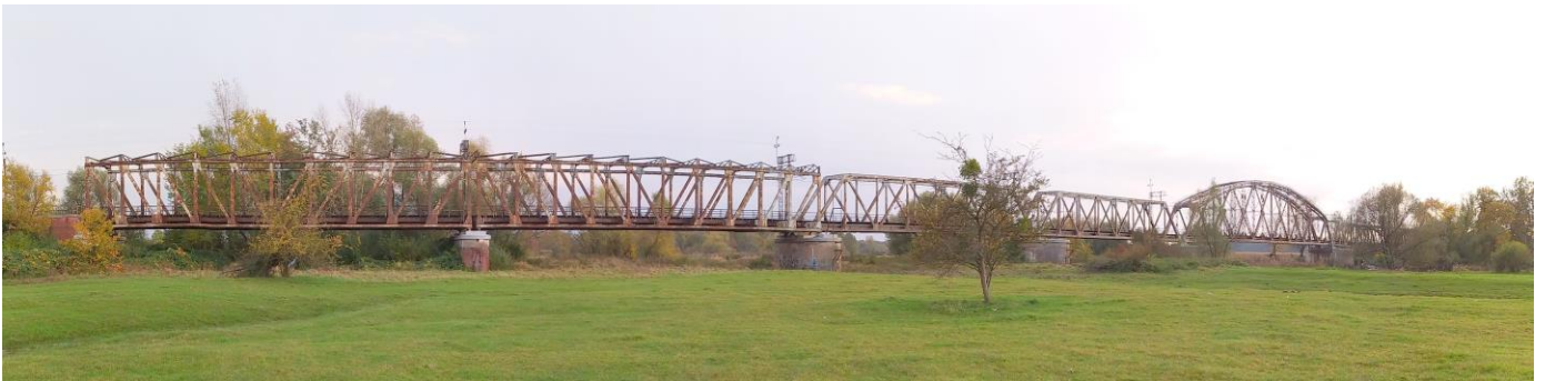
Zdjęcie nr 16. Most kolejowy w Czernicy

Budynki dworców pochodzą z końca pierwszej dekady XX w. i prezentują się dość jednorodnie; parterowe, nakryte wysokimi naczółkowymi dachami, z aneksami, o malowniczej bryle.