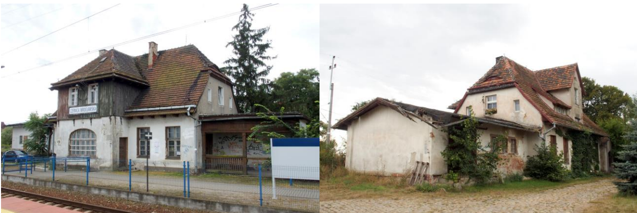
Zdjęcia: nr 17, 18. Dworzec w Czernicy i dworzec, ob. budynek mieszkalny w Nadolicach Wielkich

Budynki dworców pochodzą z końca pierwszej dekady XX w. i prezentują się dość jednorodnie; parterowe, nakryte wysokimi naczółkowymi dachami, z aneksami, o malowniczej bryle.