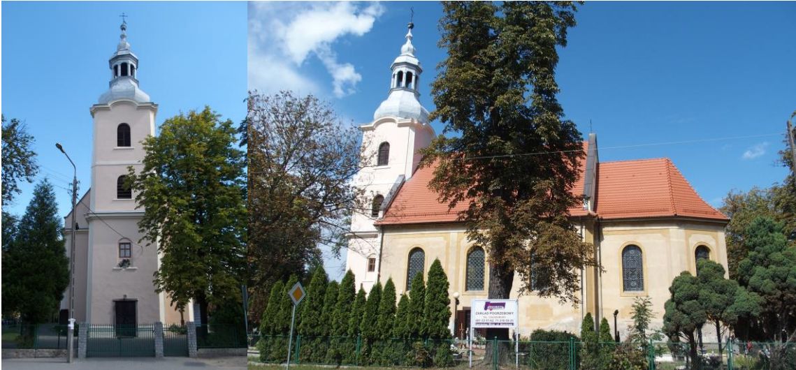
Zdjęcia nr 8, 9. Kościół pw. Narodzenia NMP w Dobrzykowicach